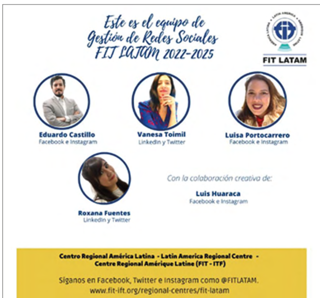
El equipo de colaboradores de redes sociales de FIT LatAm