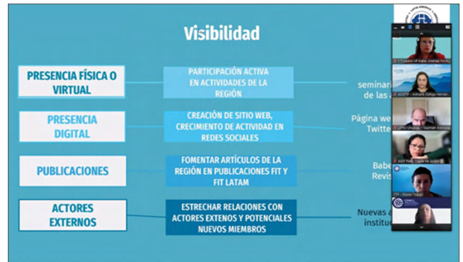
Presentación sobre el eje estratégico de visibilidad, por parte de la presidenta de FIT LatAm

Luego de la presentación sobre las estrategias regionales, se dio lugar a un fructífero intercambio, que contó con la activa participación de representantes de las siguientes asociaciones y colegios: AATI, ABRATES, ACOTIP, ACTI, ACTTI, AGIT, ANTIO, APTI, ATIEC, CONALTI, COTICH, CTPCBA, CTP, CTPSF y CTPU. A juzgar por la participación y los comentarios recibidos, fueron dos horas muy productivas en las que las autoridades presentes pudieron expresarse y compartir ideas y proyectos.