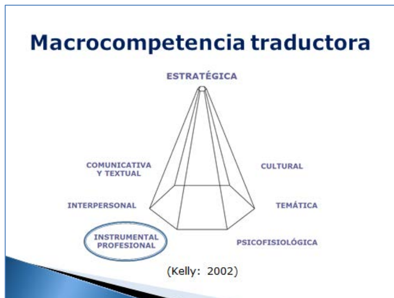
Figura 1. La macrocompetencia traductora, según Kelly (2002: 15)