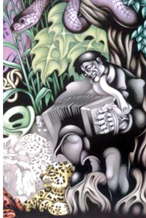
Se formaba ronda pa' verlos bailar, Ricardo Carpani

El aluvión español constituyó lo que puede llamarse, una “segunda hispanización”. En cuanto a la influencia del italiano –particularmente dialectos genovés, napolitano, calabrés, etc., y el francés, se acusó, con mayor presencia en el segundo, en el lunfardo, jerga carcelaria, extendida primero a los arrabales de Buenos Aires, y luego, con gradual penetración en el habla vulgar y luego coloquial porteña, no nacional. Muchas de las aproximadamente cuatrocientas voces de origen lunfardo (lunfardo histórico) se convirtieron en argentinismos: “laburo”, “mina”, “bacán”. El lunfardo no es un dialecto, sólo es un léxico y unos pocos modismos.