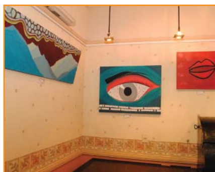
Nerea Gutiérrez "Disco" "Ojo de pez" "Ojo de cebra" "Sin título" "Salkantay"