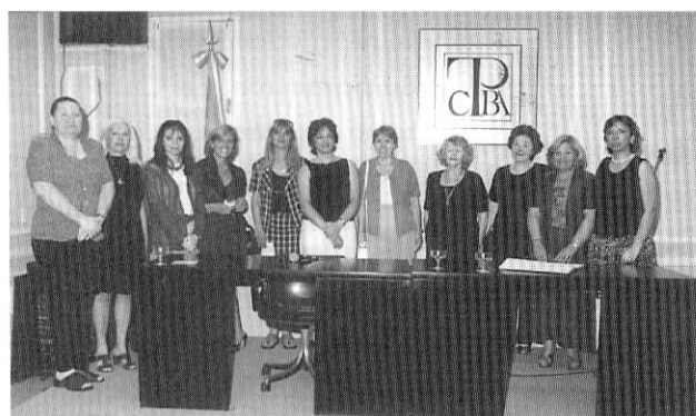
Las expositoras de Traduarte 2000 con miembros de la Comisión de Cultura.