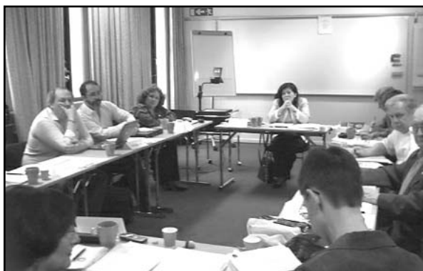
La FIT en pleno debate

Informé también sobre las actividades de la UADE, miembro asociado de FIT y sobre las últimas novedades