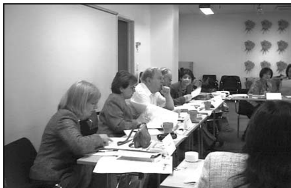
El Consejo General durante la reunión

relacionadas con nuestra Federación Argentina de Traductores (FAT) la que, de hecho, es una de las únicas dos Federaciones de traductores del mundo. Un reconocimiento muy especial mereció el informe que brindé sobre la gestión del Centro Regional América Latina (CRAL), gestión que fue ampliamente elogiada y aprobada.