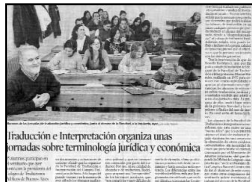
Heraldo de Soria, domingo 30 de noviembre de 2003

Durante dos días, intenté aproximar a los alumnos al difícil arte de traducir expresiones y vocablos jurídicos. Trabajé sobre la comparación de la normativa argentina y la española y, si bien ambos sistemas son bastante similares, las diferencias entre los vocablos traspasan las fronteras y, al comparar el idioma que se utiliza en España con el de los otros países hispanohablantes, las diferencias saltan a la vista. Más aún cuando observamos, en particular, las expresiones legales.